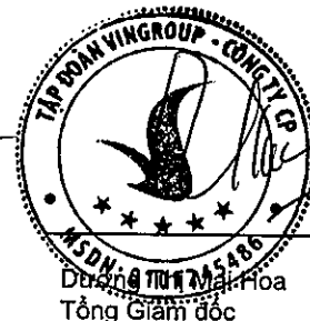
Tổng Giám đốc